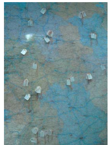
(Landkarte der Teilnehmer)