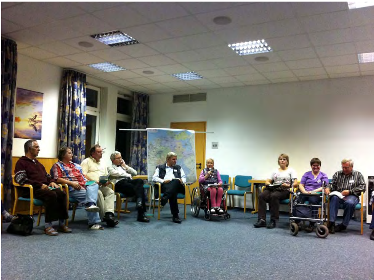
Eröffnungsrunde im Tagungssaal des Evangelischen Allianzhauses