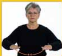
[ist das] Reich Reich